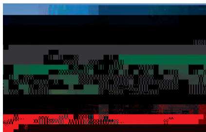
東京駅八重洲口 グランルーフ (ファサード)