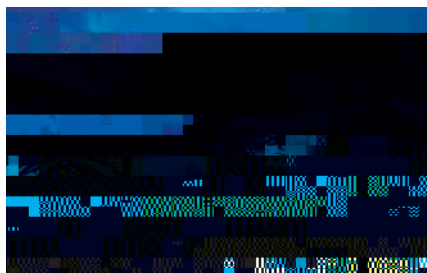
新豊洲 Brillia ランニングスタジアム (ETFEフィルム膜構造)

できるようになったのも転勤のおかげと思えるよう になりました。保守的な性格から昔は転勤したく ないと思った時期もありまし、 太陽電池など環境にやさしい新素材・新製品をお 届けしています。生活を見渡すと、私たちの技術があ らゆる場所で利用されるようになってきています。 創業からじ 繼u 隼賣ト